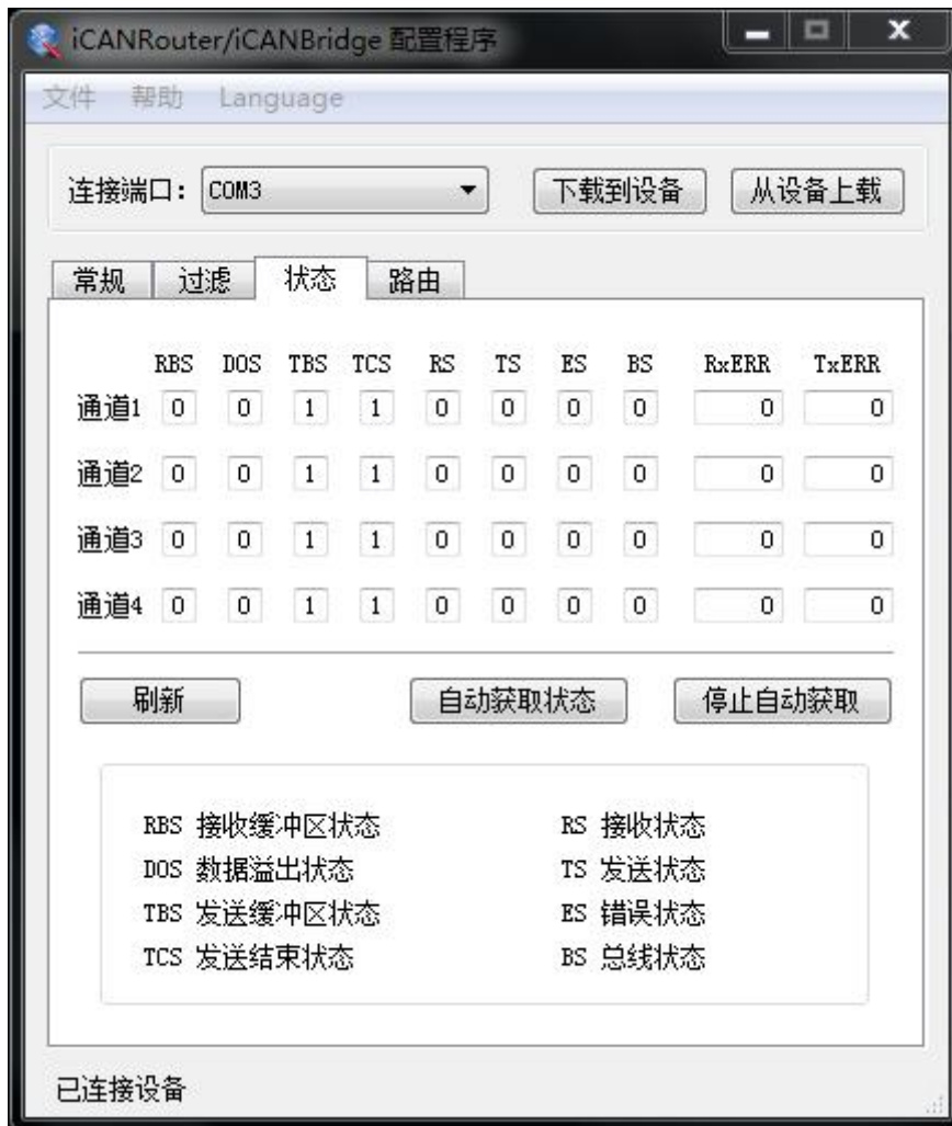
图 3.4 CAN 总线状态监测

可以通过配置程序实时监视 iCAN-Bridge 各个通道的状态。在“状态”标签下点击刷新按钮，软件界面上即可显示设备各个通道的工作情况，如图 3.4 所示。下表列出了各个参数的具体含义。