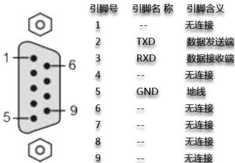
图 2.1 RS232 信号定义

iCAN-Bridge 通过 RS232 接口来配置。图 2-1 显示了 iCAN-Bridge 上的 RS232 接口的引脚定义。