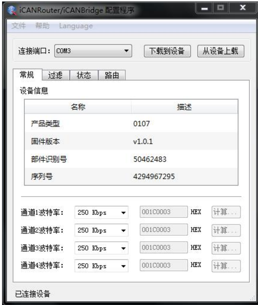
图 3.2 设置波特率

配置软件已经预置了若干个波特率，其中一些是符合 CiA 推荐的波特率要求的。但有些预置的波特率并不一定能满足实际场合的要求。因此配置软件提供给用户自定义波特率的功能。波特率有很多元素是用户可定义的。iCAN-Bridge 使用一个 32 位的数值描述整个波特率，其结构如下所示。