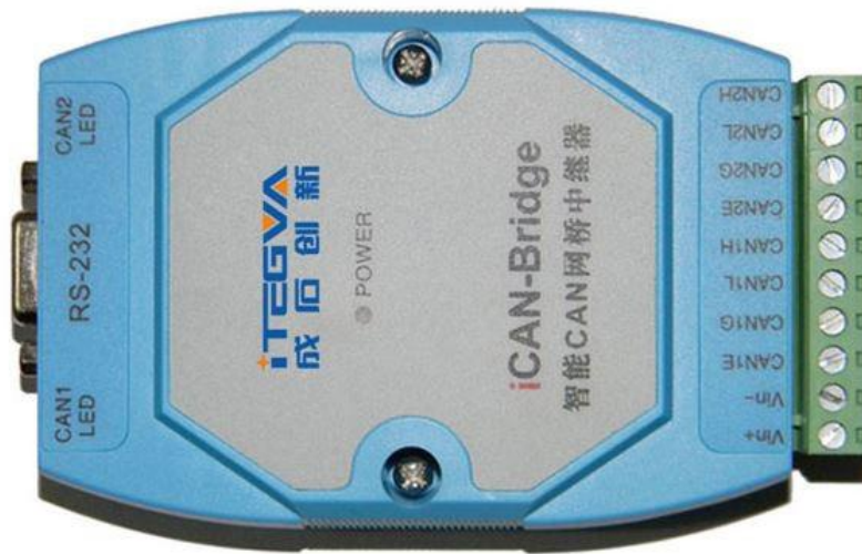
图 1.1 iCAN-Bridge 智能 CAN 网桥中继器外观图